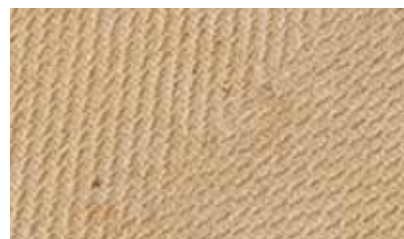
Powierzchnia zewnętrzna płyt izolacyjnych STEICO top

Ponadto płyty STEICO top są szczególnie otwarte dyfuzyjnie. Jeśli do materiału dostanie się nadmiar wilgoci, płyta bez problemu odprowadzi ją na zewnątrz. W rezultacie znacząco redukuje ryzyko powstawania grzybów.